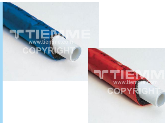
Per la gamma completa vedere il catalogo / For complete range see catalogue

Multilayer pipe (see technical sheet 0660 for more information) with PE-LD coating for water, sanitary and heating systems with an high resistance to steam diffusion.